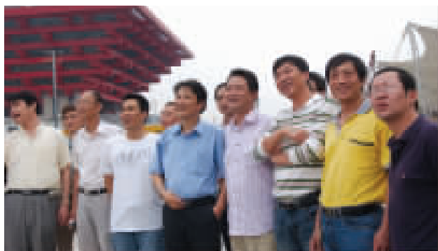
◆ 宝钢员工参观建设中的世博园区