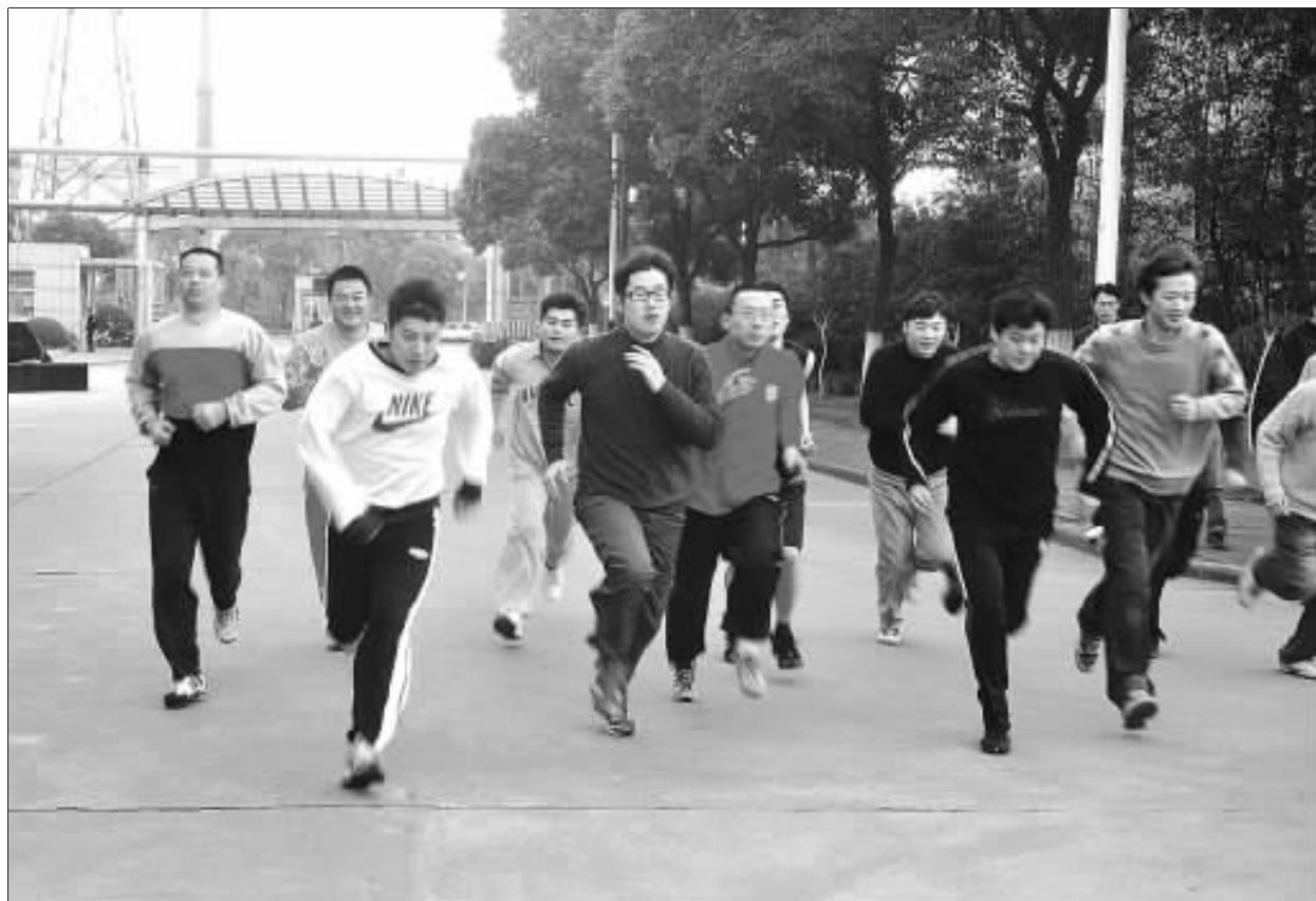
昨天清晨,宝钢股份冷轧薄板厂在厂区大道上举行了“迎新年、迎世博”长跑比赛,数十名员工意气风发地奔向充满希望和挑战的2010年。

佳实践者活动。如设备点检员积极开展自力维修项目,自己动手解决问题;运行操作维护岗位上的员工,精益求精,努力提升机组的技术经济小指标。“一个提炼”,即将员工在现场的良好行动提炼为精神,在挖掘、培养、树立、宣传的过程中,电厂一方面通过制作展板、编发事迹材料等活动,全力营造“比、学、赶、帮、超”的氛围;另一方面注重提炼最佳实践者所展现的宝贵精神。让全体员工不仅看到了他们在自身岗位上的“最佳实践”行动,更是让员工感染了他们在一时一事上闪现出的勇挑重担、智慧降本、严格把关的主人翁精神。电厂要求所属单位从完善工作机制、明确活动主题等方面着手,不断完善和落实各项工作举措,使最佳实践者活动深入持久地开展下去。