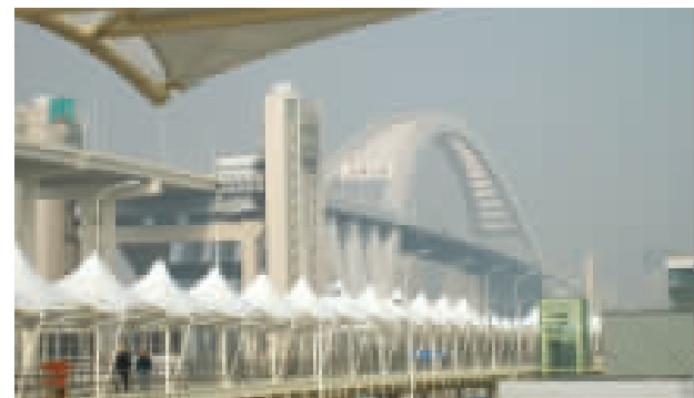
▲由宝钢理公司担任监理的高架人行平台工程

主题馆,运用“里弄”、“老虎窗”的构思,通过“折纸”的手法,形成了立体感很强的建筑特色。