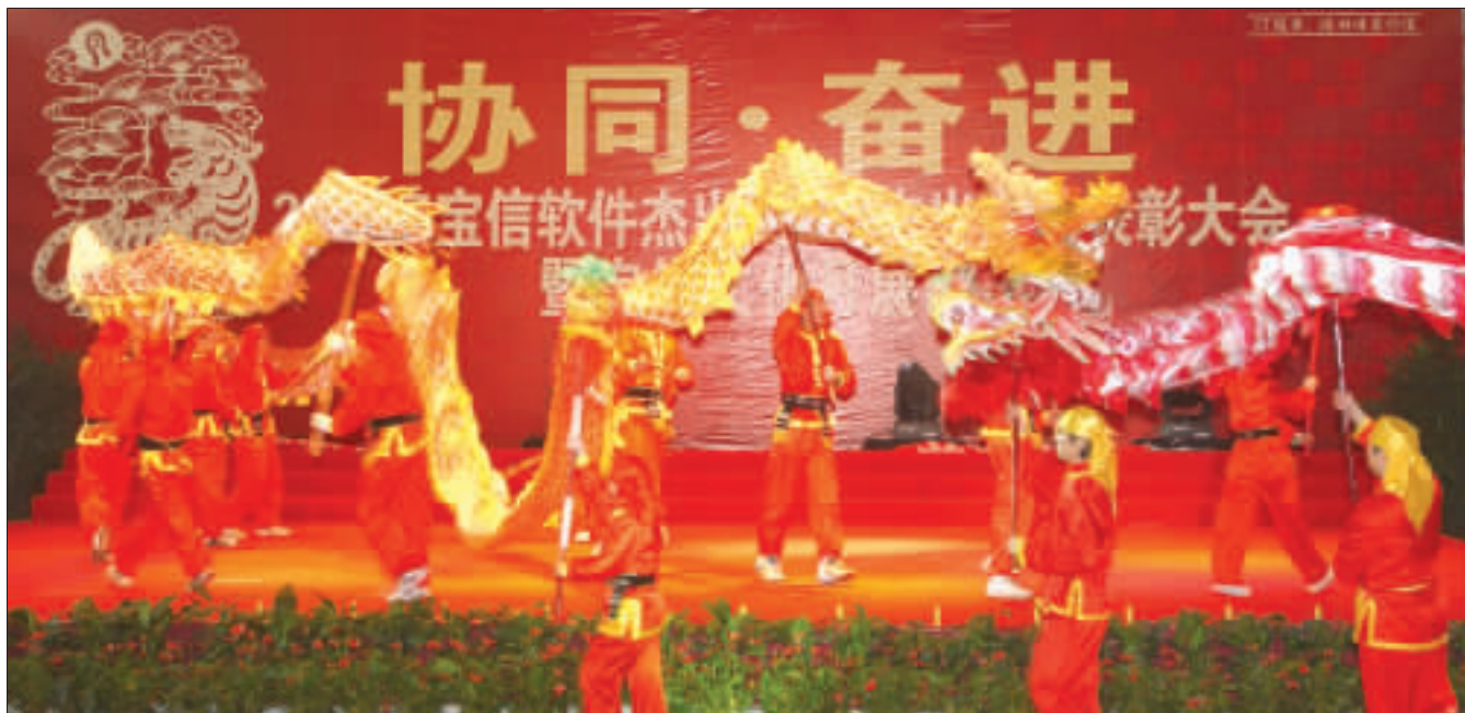
昨天下午，宝信软件在宝钢体育馆举行了“协同·奋进”杯2009年杰出员工、杰出团队表彰大会暨文化月展示活动。图为宝信软件员工正在表演自编自导的节目《欢庆龙舞》。