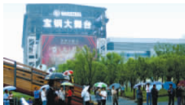
▲由原浦钢特钢车间改造成的“宝钢大舞台”